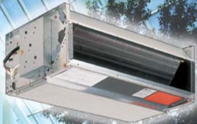
Модель FCK горизонтального типа